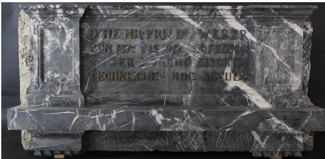
Abbildung 2: Das dreiteilige Denkmal für Professor Heinrich Weber